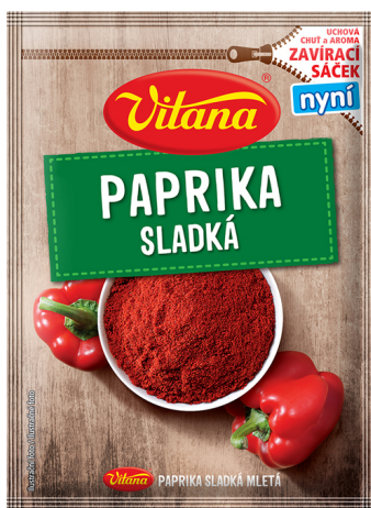
Paprika sladká mletá