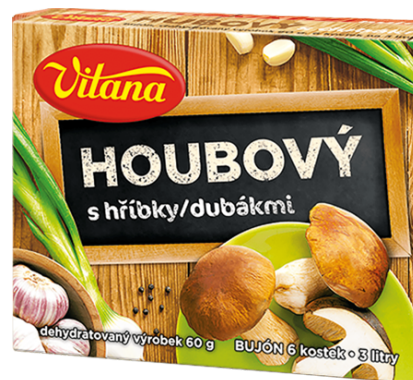
Hubový bujón s dubákn